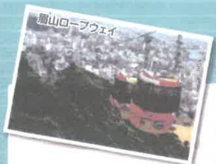
眉山ロープウェイ