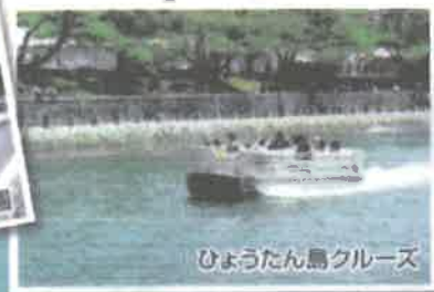
ひょうたん島クルーズ