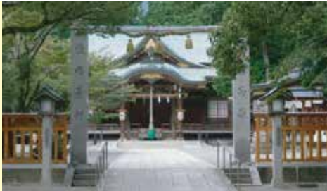
県内一の大神「大麻はん」 おみくじを引いたりお守りを買ったり♪

コース: 鳴門ウチノ海総合公園→小鳴門大橋→国道11号線(北灘町)→県道41号線→卯辰越峠→ 大麻比古神社(参拝)→県道41号線→県道12号線→県道28号線→県道42号線→小鳴門大橋→ 鳴門ウチノ海総合公園