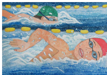
「自己ベストをめざせ!」