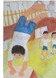
「できたぞ ハンドスプリング」