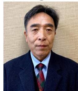
石井町スポーツ協会会長